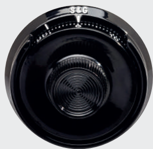
Serrure à combinaison mécanique