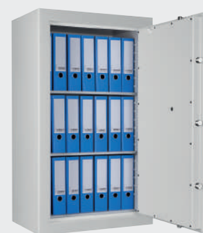
Armoire forte HCC T2