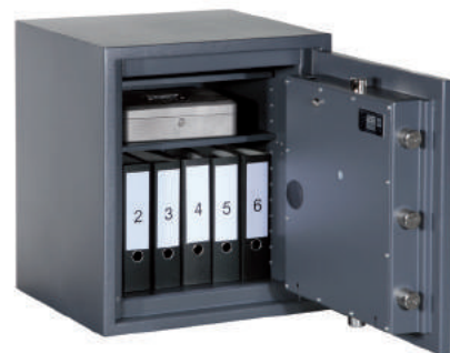
Coffre-fort classe IIIE