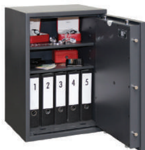
Coffre-fort classe IE