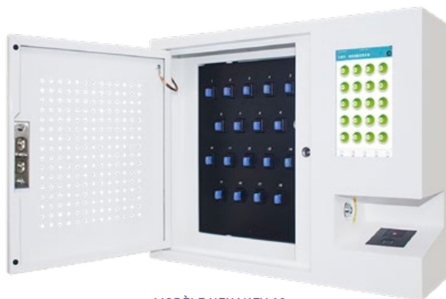
MODÈLE HEXAKEY 18 (18 CLÉS)