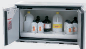
PSD -30 T1