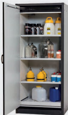
PSD -30 T3