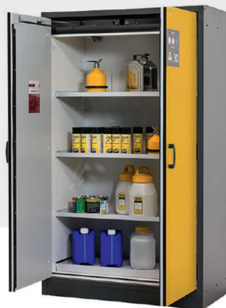
PSD -30 T4