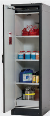
PSD -30 T2