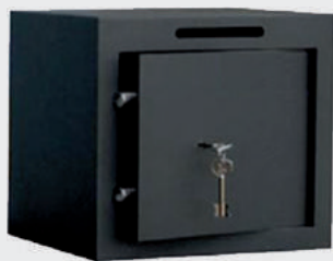
Cashdrop T1 serrure clé