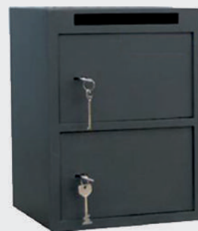
Cashdrop T1 serrure clé