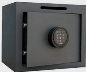
Cashdrop T1 serrure clé