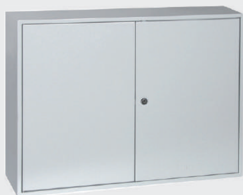
C XL T5