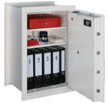
Coffre-fort à emmurer ouvert