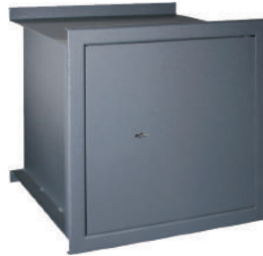
Coffre-fort à emmurer fermé